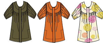
Tunique "Ekta" Réf. 286 voile