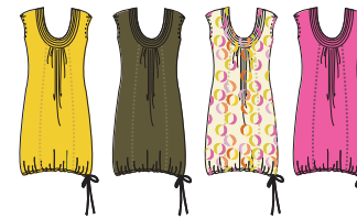
Robe "Vénus" Réf. 252 jersey