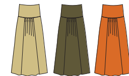
Jupe longue à plis "Mauka" Réf. 207 interlock