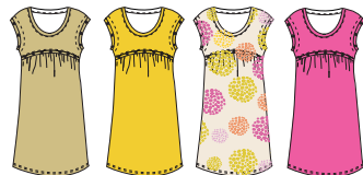
Robe "Gazelle" Réf. 230 jersey