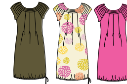
Robe sans manches "Sharav" Réf. 297 interlock