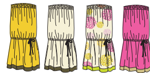
Robe bustier/Jupe "Pampa" Réf. 237 voile