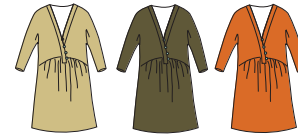
Tunique "Amazonia" Réf. 221 jersey et voile