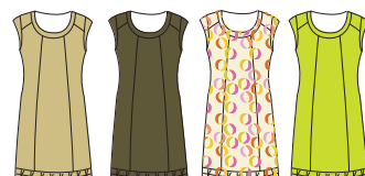
Robe "Laguna" Réf. 235 coton piqué