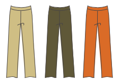
Legging ample "Jacamar" Réf. 231 jersey elasthane