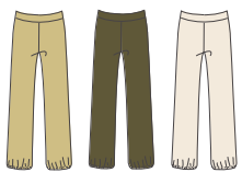
Pantalon "Boreas" Réf. 215 interlock