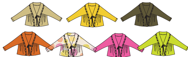
Gilet top "Caravan" Réf. 227 jersey