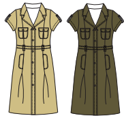
Robe "Dune" Réf. 229 sergé de coton