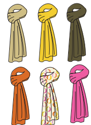
Echarpe "Boa" Réf. 223 jersey