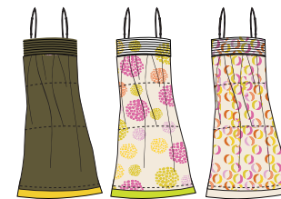
Robe "Savanna" Réf. 243 voile