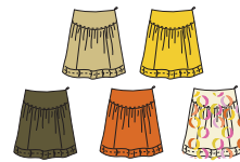
Jupe courte à fronces "Papua" Réf. 238 coton piqué